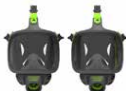
Maschere a Pieno Facciale BLS 3400 - BLS 3150 (V)