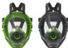
Maschere a Pieno Facciale BLS 5400 - BLS 5150