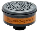
Filtri serie BLS 400